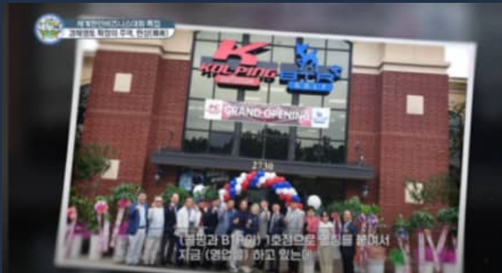
▲ 성공사례 2