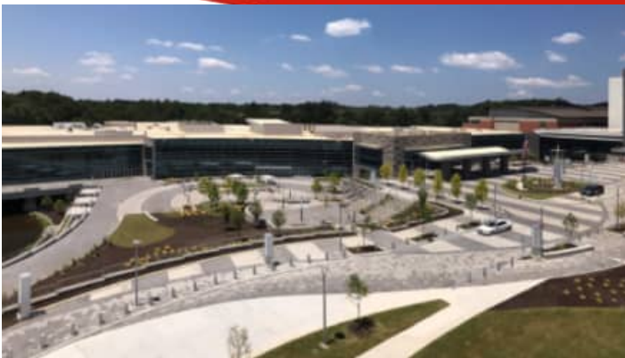
Gas South Convention Center

세계 주요 교통 허브로서 명성을 얻고 있는 애틀랜타는 전 세계 기업들이 접근하기에 매우 편리한 도시입니다. 애틀랜타에는 코카콜라와 UPS를 비롯한 여러 글로벌 기업들의 본사가 있으며, 활기찬 경제와 번영하는 비즈니스 생태계는 국제적인 파트너십을 촉진하고 무역 관계를 강화하는 데 최적화되어 있습니다. SK 배터리, 현대자동차, 한화큐셀 등 한국의 대기업들도 애틀랜타 지역에 생산 라인을 건설하여 수천 명의 직원을 고용하고 지역 경제 활성화에 큰 기여를 하고 있습니다. 지난 10년간 조지아주 한인 인구는 30% 이상 증가하여 현재 약 20만 명의 한인 커뮤니티가 애틀랜타와 그 인근 지역에 형성되어, 본 행사에 많은 사업가들이 방문할 것으로 예상됩니다. 새로 증축된 가스 사우스 컨벤션 센터와 지역 정부의 적극적인 협력은 성공적인 대회를 기대하게 합니다. 애틀랜타에서 미국 내 네트워크를 구축하고 협력하며, 참가 기업들이 성공을 위한 도약을 하기를 기대합니다.