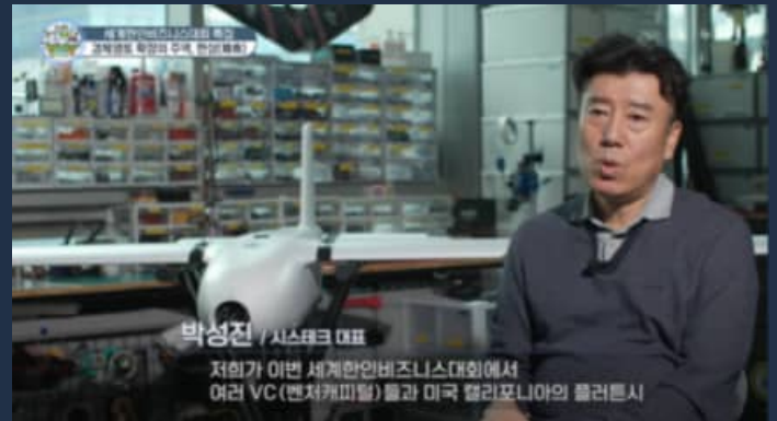
▲ 성공사례 3