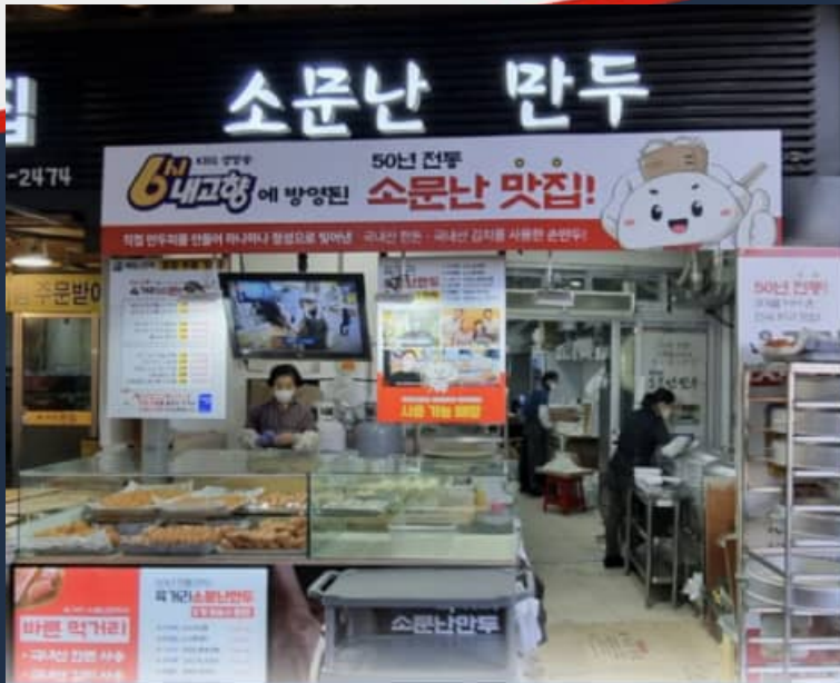
◀ 성공사례 5