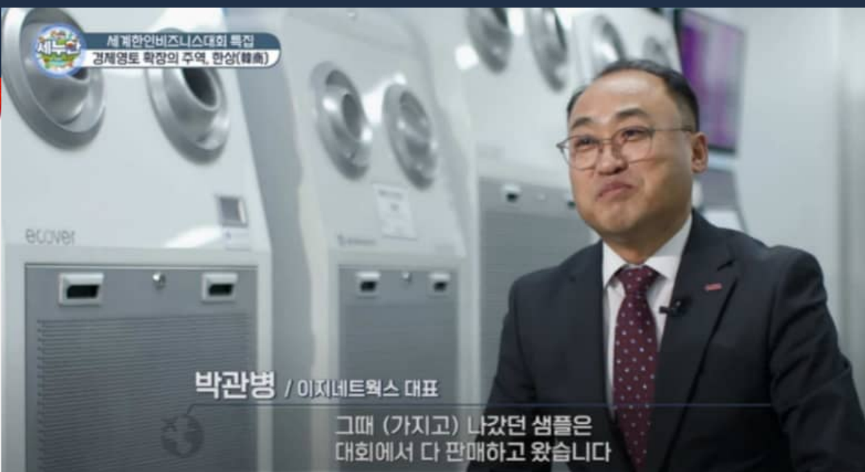
◀ 성공사례 4