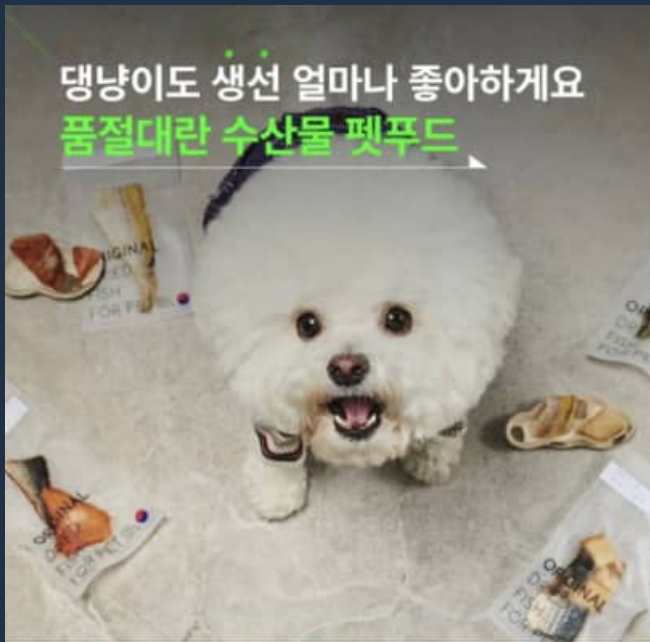
▲ 성공사례 6