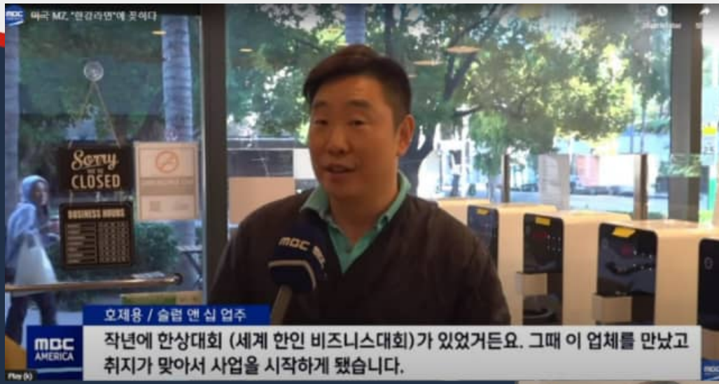
◀ 성공사례 1